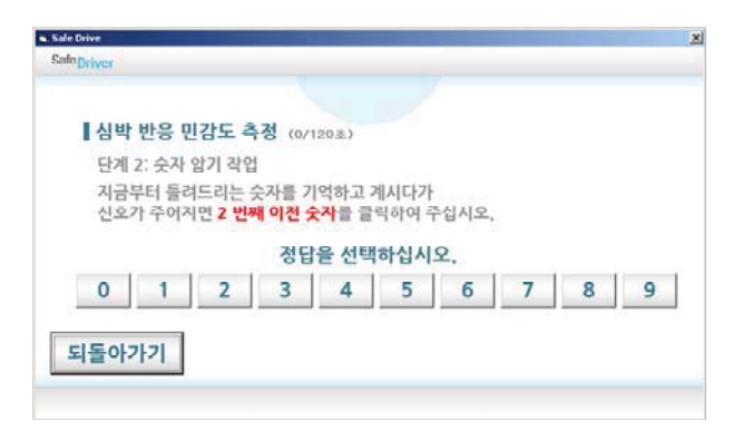
Figure 4. N-back task (illustrated)

두 번째 단계에서는 그림 5에 나타낸 것과 같이 3분 동 안 기준치를 설정하게 된다. 기준치는 3분 동안의 주행 중 에 파악되며, 3분이 지나면 자동으로 실시간 분석 화면으로 전환되게 된다.