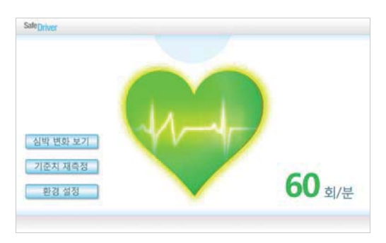
(a) Low workload (stable)