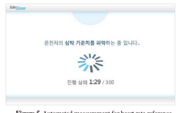
Figure 5. Automated measurement for heart rate reference (illustrated)

두 번째 단계에서는 그림 5에 나타낸 것과 같이 3분 동 안 기준치를 설정하게 된다. 기준치는 3분 동안의 주행 중 에 파악되며, 3분이 지나면 자동으로 실시간 분석 화면으로 전환되게 된다.