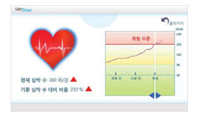
Figure 7. Heart rate history indicator (illustrated)