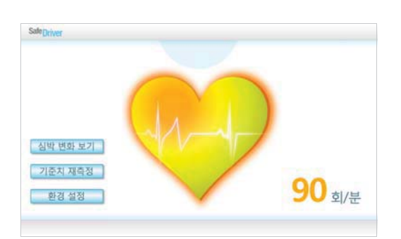
(b) Middle workload (unstable)