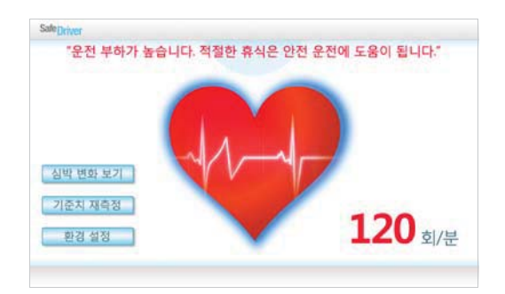
(c) High workload (dangerous) Figure 6. Workload indicator (illustrated)